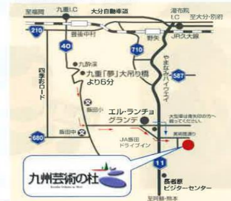
九州芸術の杜 アクセスマップ